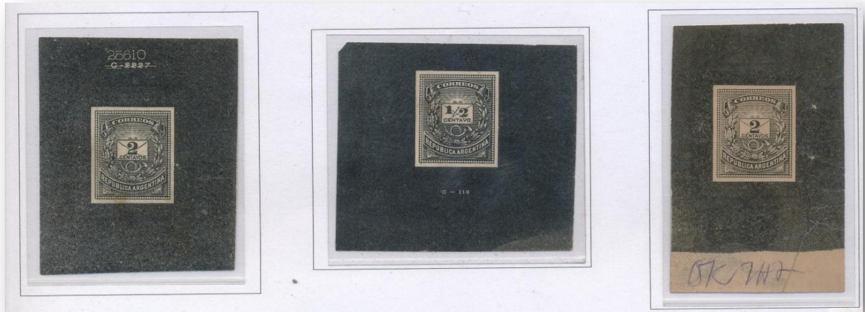
Pruebas de los sellos de 1/2 y 2 centavos".