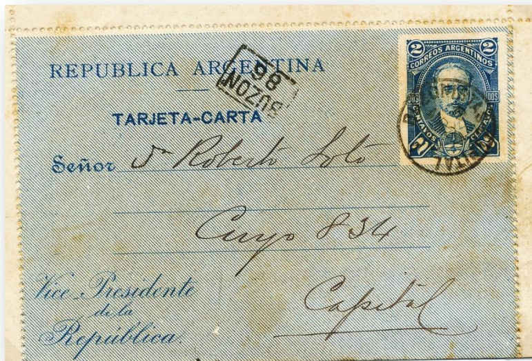
Tarjeta carta del Vicepresidente de la República circulada.