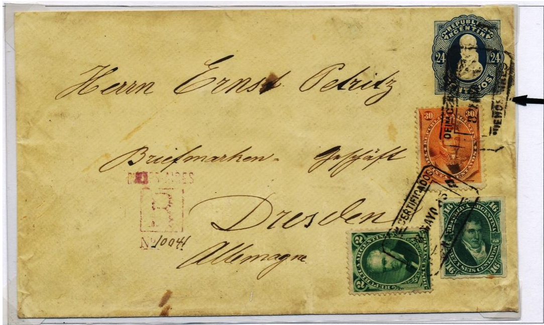
Sobre enterpostal considerado como una de las cartas más importantes del correo argentino por figurar entre su franqueo complementario uno de los seis únicos ejemplares del sello de 30 centavos dedicado a Carlos María de Alvear que se conocen circulados en cartas.