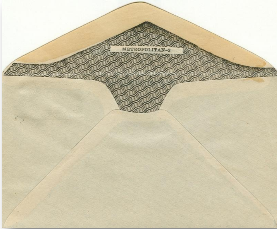
Fig. E1.- Reverso y forro de seguridad en los sobres de entrega inmediata.