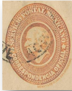
Fig. O3.- Sello de los sobres enteropostales oficiales de México.

Los sellos grabados en estos sobres eran muy similares a los sellos adhesivos emitidos en aquellos años por el Correo mexicano. Se trataba de un diseño oval con el busto de Hidalgo y las leyendas "SERVICIO POSTAL MEXICANO CORRESPONDENCIA OFICIAL", y fuera del óvalo, abajo a la derecha, "MEXICO OFICINA DEL GOBIERNO", en color rojo (ver Fig. O4). El papel comúnmente utilizado para estos sobres era verjurado, sin marca de agua, en distintos tonos de blanco, amarillo o anaranjado (ver Figs. O5 y O6).