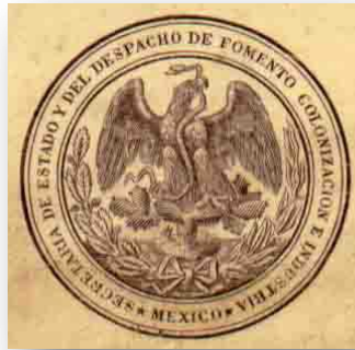
Fig. O1.- Sello de la Secretaría de Estado y del Despacho de Fomento, Colonización e Industria.