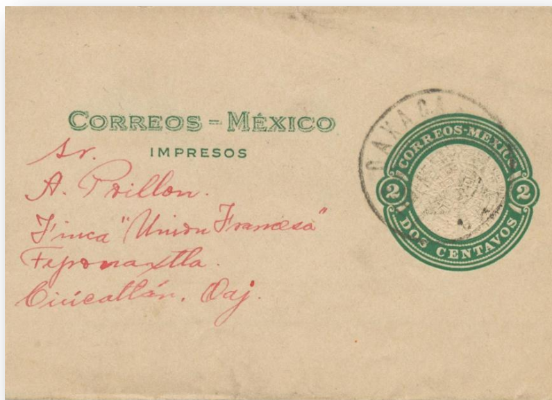
Fig. 691.- F43 circulada a Oaxaca (México).