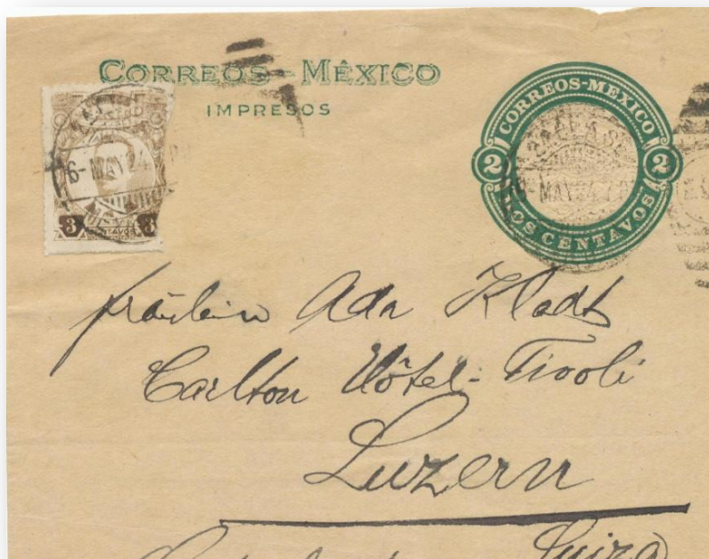
Fig. 692.- F43 circulada a Lucerna (Suiza) con franqueo adicional.