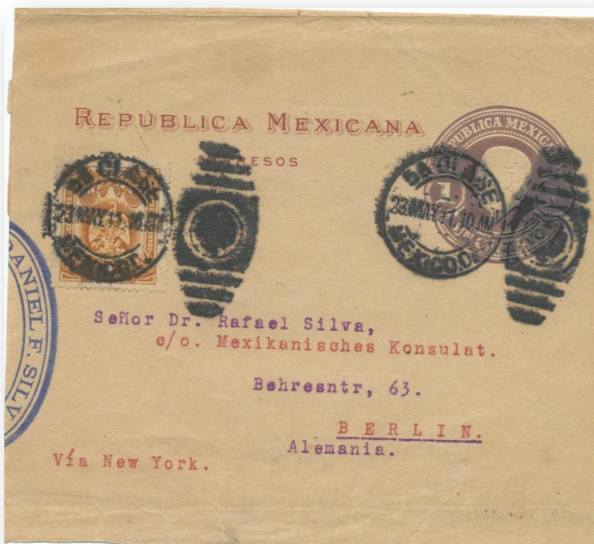
Fig. 675.- F40 circulada a Berlín (Alemania) con franqueo adicional. Papel beige oscuro e impresión en marrón oscuro.

Es posible encontrar variedades de color en todas las fajillas de esta emisión. Esto puede apreciarse en las distintas ilustraciones de esta emisión y en las de las dos siguientes.