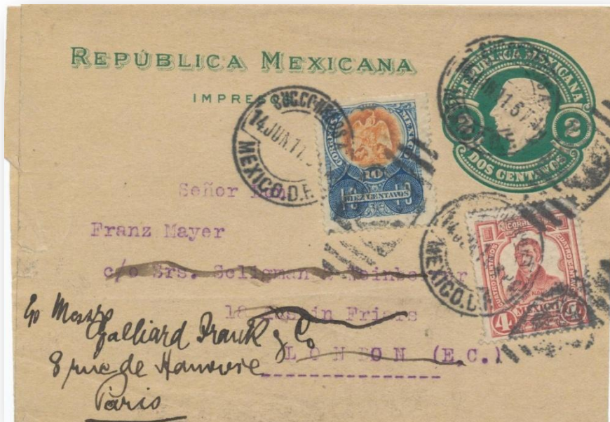
Fig. 677.- F41 circularada a París (Francia) con franqueo adicional. Papel beige claro e impresión en verde oscuro.