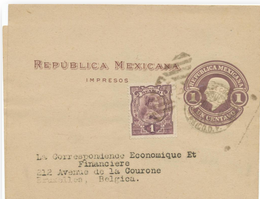
Fig. 676.- F40 circulada a Bruselas (Bélgica) con franqueo adicional. Papel beige claro e impresión en marrón claro.