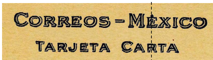
Fig. 663.- Encabezado de las tarjetas-carta de 1923.

En estas tarjetas-carta la “E” de la palabra “MEXICANO” normalmente recae sobre la “R” de “CARTA” (ver Fig. 663) aunque existen ejemplares de TC33 en los que recae entre el espacio que existe entre las letras “A” y “R” de “CARTA”.