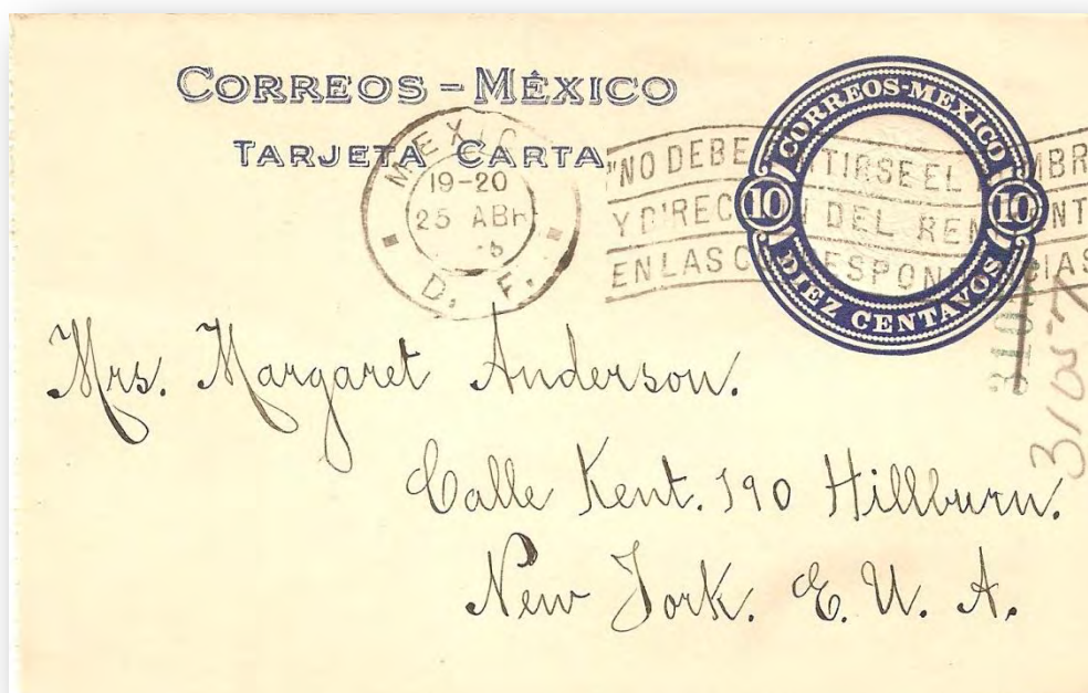
Fig. 665a.- TC32 circulada a Nueva York (EE.UU.).