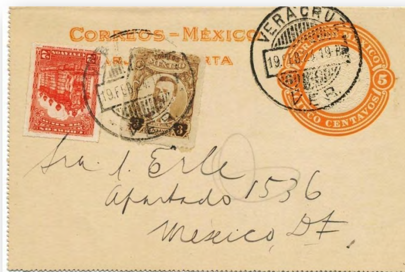
Fig. 664.- TC31 circulada a Ciudad de México con franqueo adicional. Impresión en color naranja oscuro.

También es posible encontrar variedades en las perforaciones de estas tarjetas-carta, tanto en las horizontales, que pueden medir de 125 a 126 mm., como en las verticales, las cuales pueden medir entre 78 y 80 mm. de alto. En ocasiones las líneas perforadas no llegan al borde de la tarjeta.