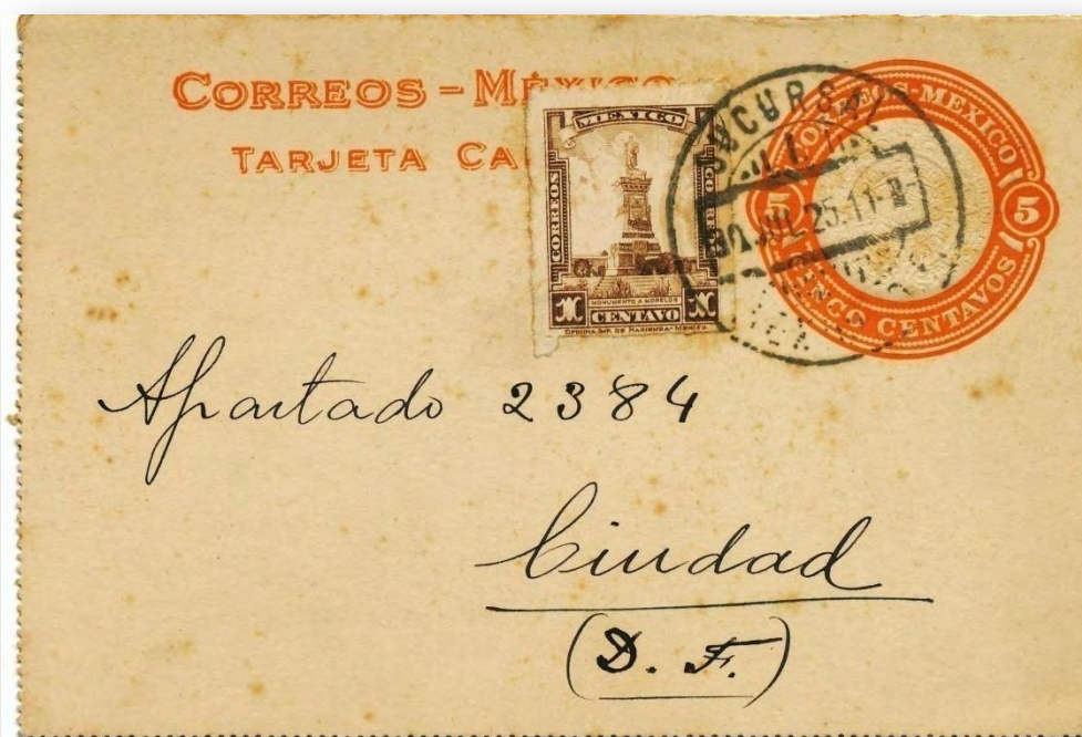
Fig. 665.- TC31 circulada. Impresión en color naranja oscuro.