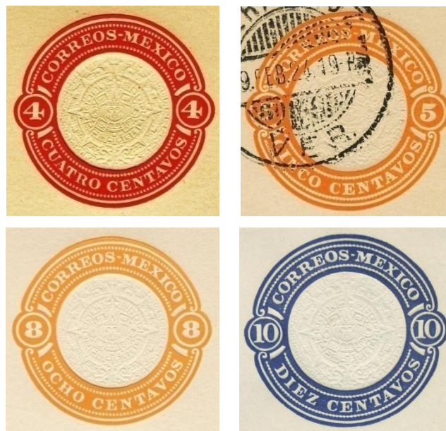
Fig. 486.- Nuevo diseño de los sellos en los enteros postales de 1923 y 1927.