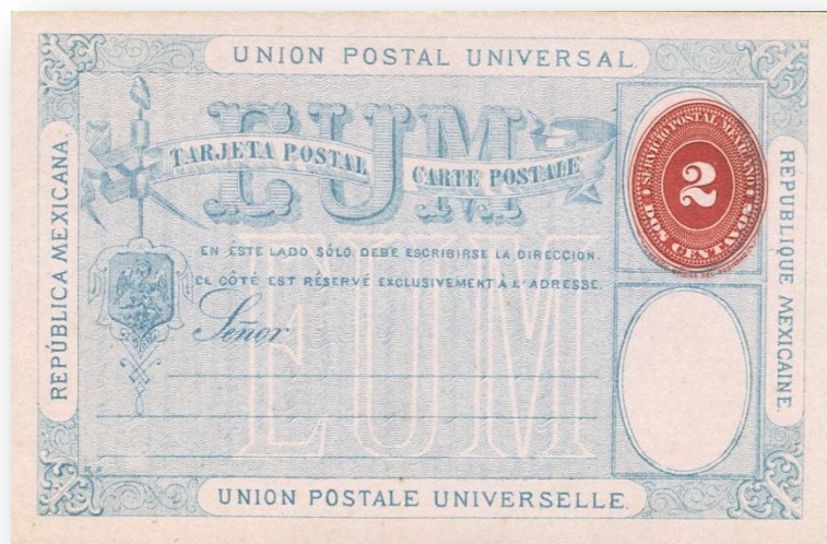
Fig. 74b.- TP4 con el texto en color azul.