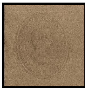
Fig. 5.- Busto en negativo en el reverso del sobre.