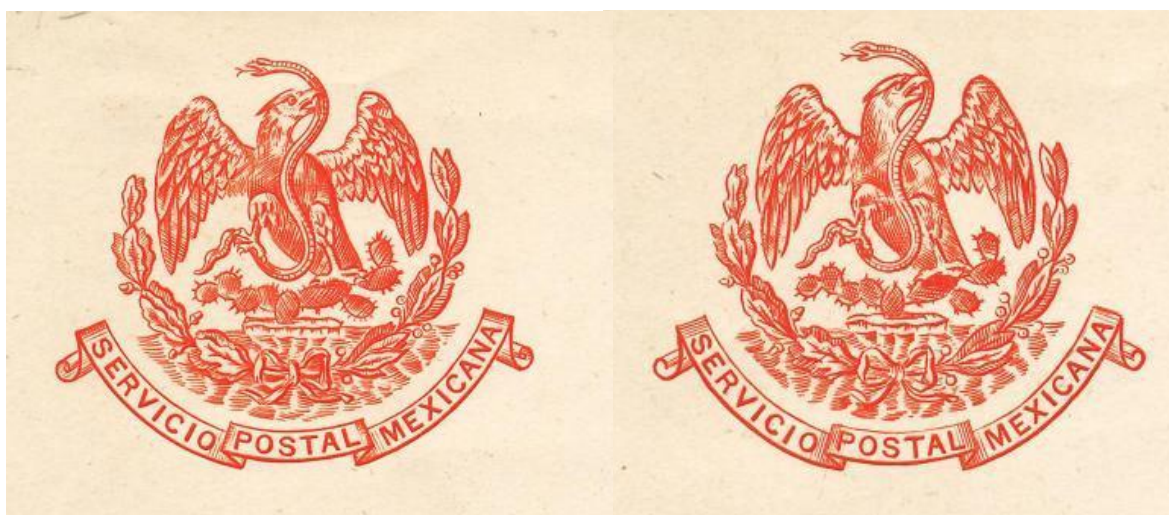
Fig. 19.- Escudos de armas Tipos I y II, respectivamente.

Se aprecian también distintas tonalidades en los colores de los diferentes valores de esta emisión.