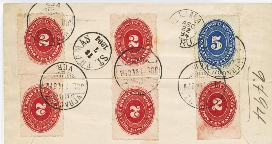
Fig. 20a.- S31 Tipo I certificado a Lima (Perú) con franqueo complementado con sellos adhesivos de la serie "numerales" en el reverso.