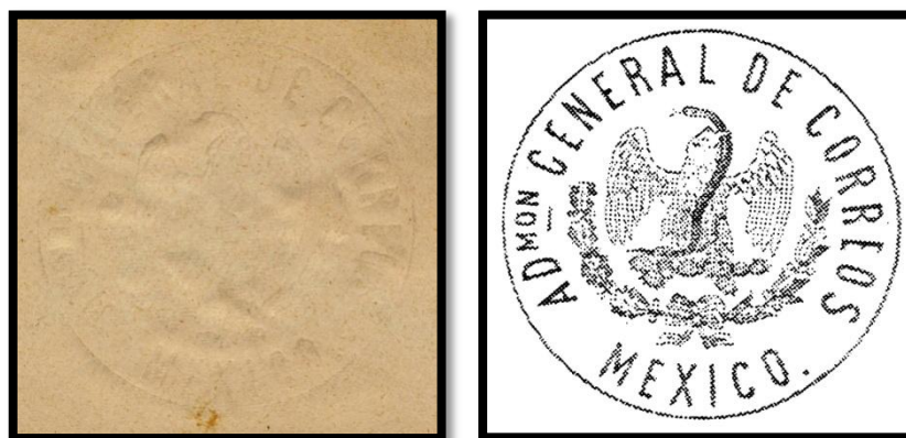
Fig. 15.- Marca de agua circular en S17.